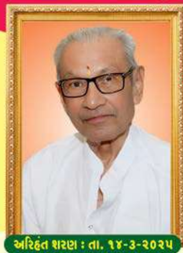
અરિહંત શરણ : તા. ૧૪-૩-૨૦૨૫