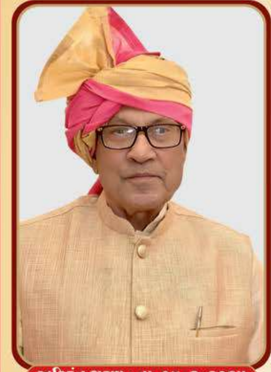
અરિહંત શરણ : તા. ૧૪-૩-૨૦૨૫